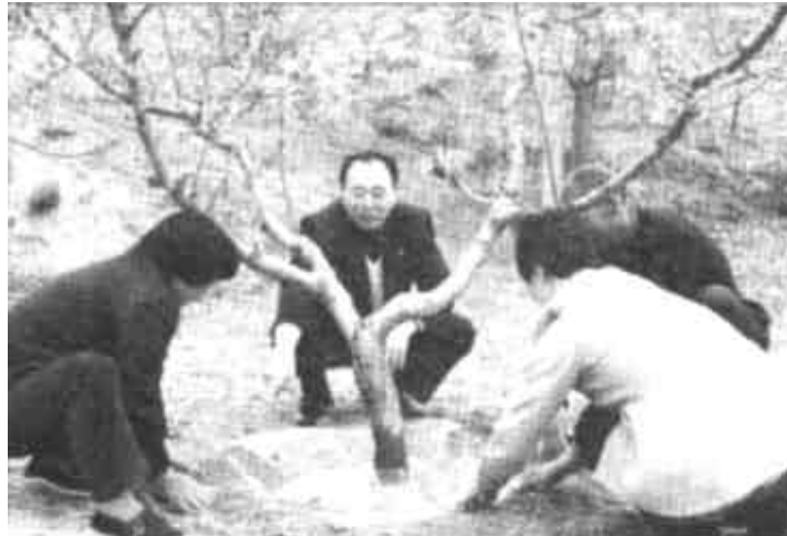
河北省顺平县水务局领导干部深入缺水山区走村串户,帮助当地农民打深井、修水窖、依山势建蓄水池搞自流灌溉,教当地农民使用地膜覆盖等节水方法,使当地农民群众不再为缺水而发愁,也使生态环境得到了明显改善。

据新华社上海5月18日电(吴宇 沈莺)今年4月份,我国最大的对外贸易口岸上海口岸进口同比增长8.3%,使今年前4个月的进口增幅由一季度的0.3%增长到2.6%。 上海海关最新统计表明,上海口岸进口出现回升,主要是由于国际贸易重新步入活跃期,上海口岸前4个月加工贸易进口58亿美元,同比增长8.8%,增幅比前3个月提高了3.3个百分点;其次,外商投资进口设备物品止跌回升,15亿美元的进口同比增长2%;保税区仓储转口货物进口17亿美元,增长17.6%。从出口商品分析,上海口岸前4个月增幅最大的出口商品是纺织纱线、织物及制品,23亿美元的出口同比增长18.4%;机电产品出口104亿美元,增长14%;服装及衣着附件出口48亿美元,增长3.6%。