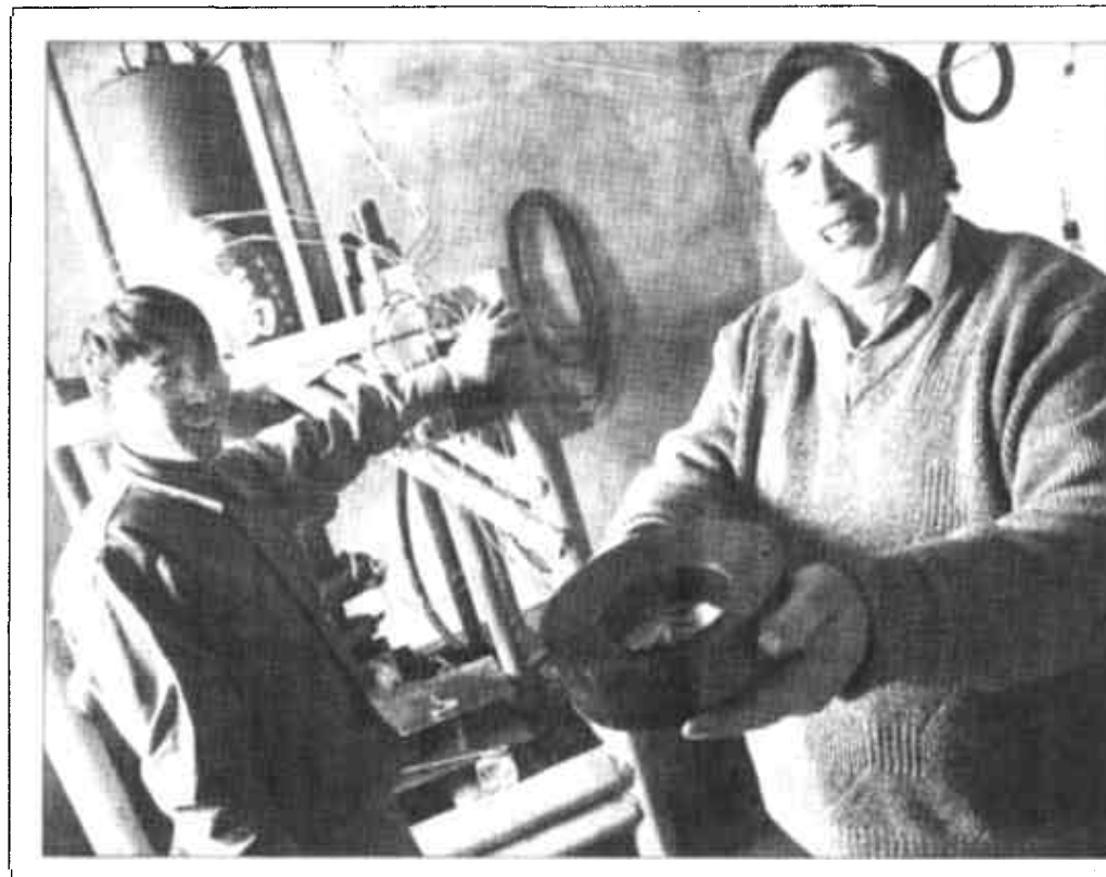
广饶县聚氨酯橡胶制品厂针对油田找市场,其生产的油田钻井泵活塞、油缸密封件等系列产品1999年已获国家专利,产品全部畅销油田,效益十分可观。