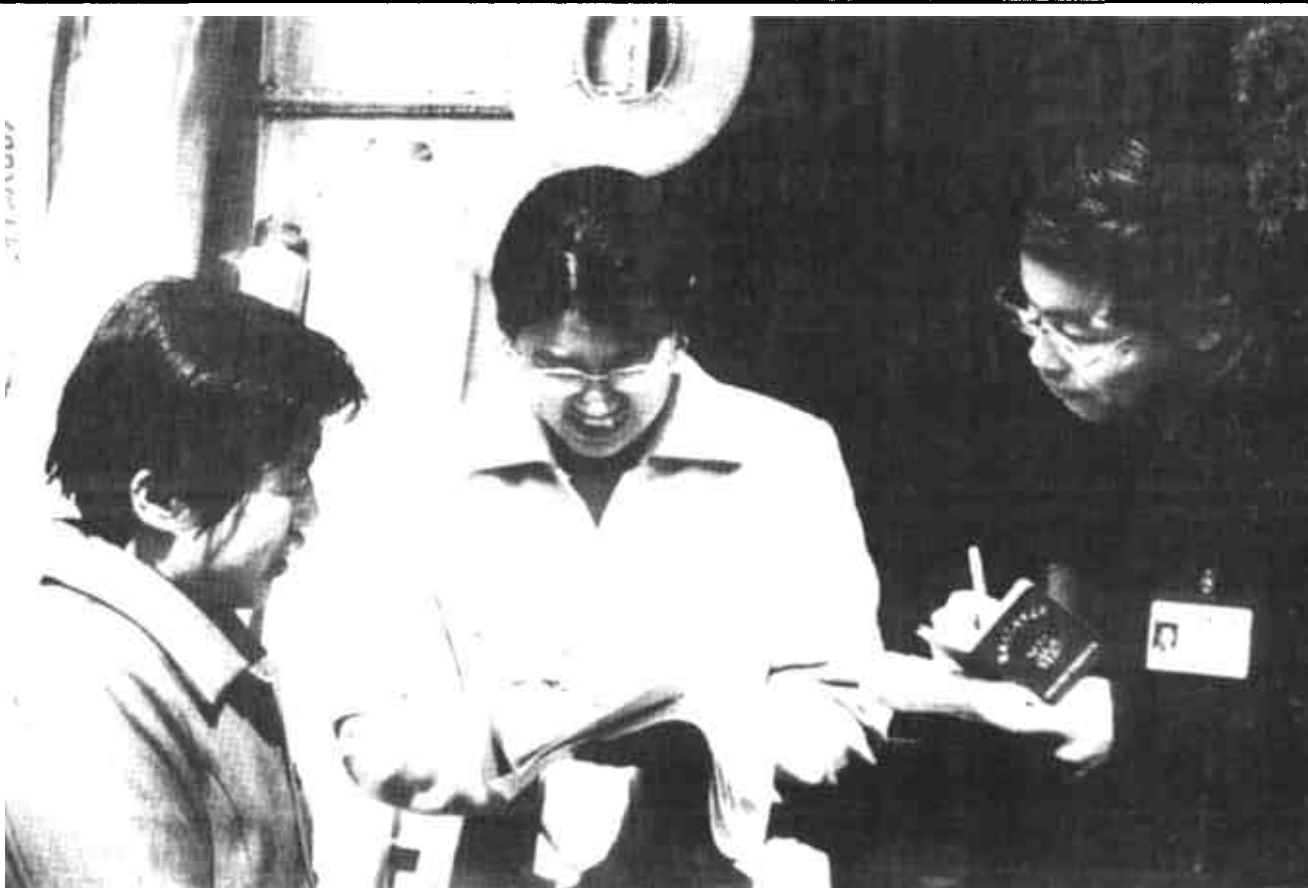
东营区文汇街道商河路社区居委会把计划生育工作严格日常化管理，通过逐户的调查摸排，掌握了第一手资料，图为工作人员上门签订计生合同。

规模养殖和畜牧小区的建设，极大地带动了区域经济的发展，调整了畜牧业的结构，提高了农民收入。(刘飞)